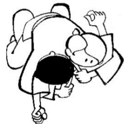
TATE-SHIHO-GATAME contrôle sternal à cheval