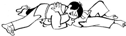
KAMI-SHIHO-GATAME contrôle arrière sternal par la ceinture