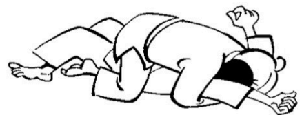
YOKO-SHIHO-GATAME contrôle latéro-sternal

YOKO signifie : côté SHIHO veut dire : quatre points GATAME : immobilisation, contrôle